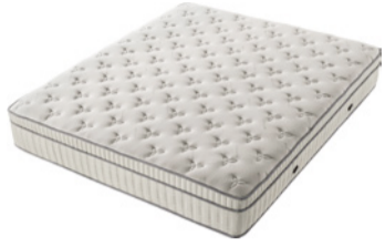
Worldclass No Flip Sistem, Memory Foam Schicht