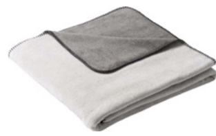
Plaid Duo Cotton Melange 50% cotton, 43% polyacrylic, 7% polyester