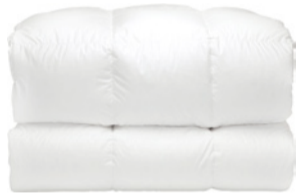
Daunenbett Neostep 400 100% Polyester, Inlett: Baumwolle