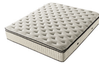
Black Diamond ZZZ Atmungsaktiver, antiallergischer Überzug