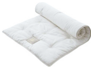
Topper Lotus Light Mit hochwertiger Polyester-Fillfaser

Verfügbare Höhen Obermatratze: 22, 23, 28 cm