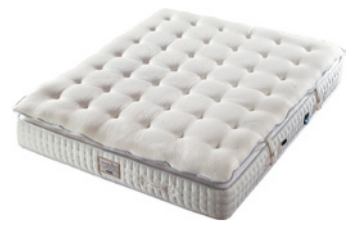
Elite Feuerfester, antiallergischer Stretch Überzug