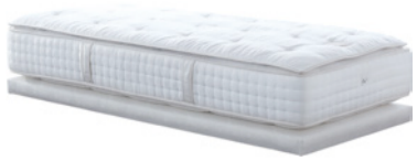
Natur Matratzen Individuell angepasste Federkernrezepturen