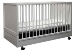
Kinderbettchen Größe: 126 x 66 x 73cm, Buche massiv

40 x 60, 50 x 70, 50 x 80, 55 x 75, 60 x 90, 80 x 80 cm