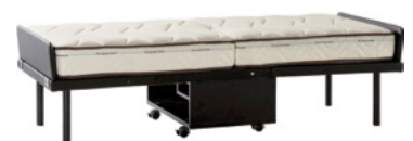
Fold Down Größe offen: 92 x 208 x H 55 cm