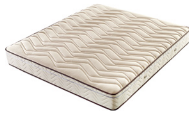
Renergie Beautyrest Feuerfester, antiallergischer Stretch Überzug