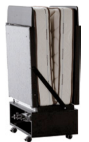
Fold Down Größe geschlossen: 92 x 49 x H 140 cm